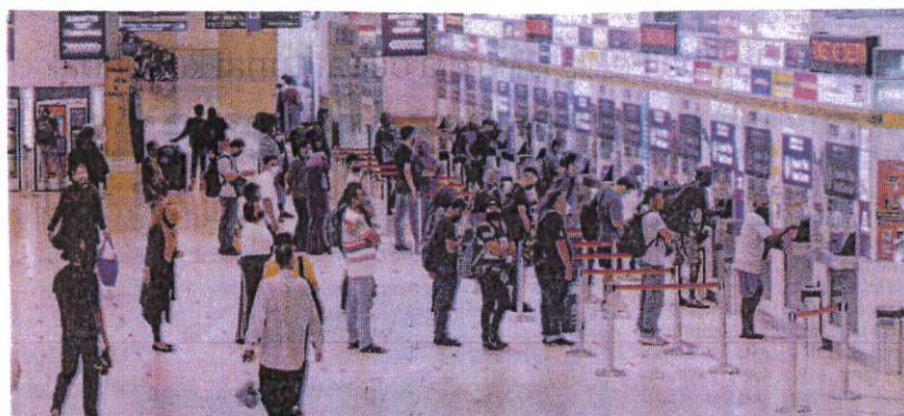
ORANG ramai membeli tiket bas untuk pulang ke kampung menyambut Aidilfitri di Terminal Bersepadu Selatan (TBS), Bandar Tasik Selatan, Kuala Lumpur semalam.

AKHBAR : KOSMO MUKA SURAT : 4 RUANGAN : NEGARA