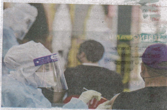
JFK menjalankan penilaian terhadap 25 laporan yang telah lengkap penyiasatan dan mendapati kes-kes kematian terlibat tiada hubung kait dengan vaksin dos penggalak Covid-19 yang diterima.

Daripada jumlah keseluruhan laporan AEFI yang diterima, terdapat 1,840 laporan dikategorikan sebagai AEFI serius berdasarkan klasifikasi Pertubuhan Kesihatan Sedunia (WHO). - Bernama