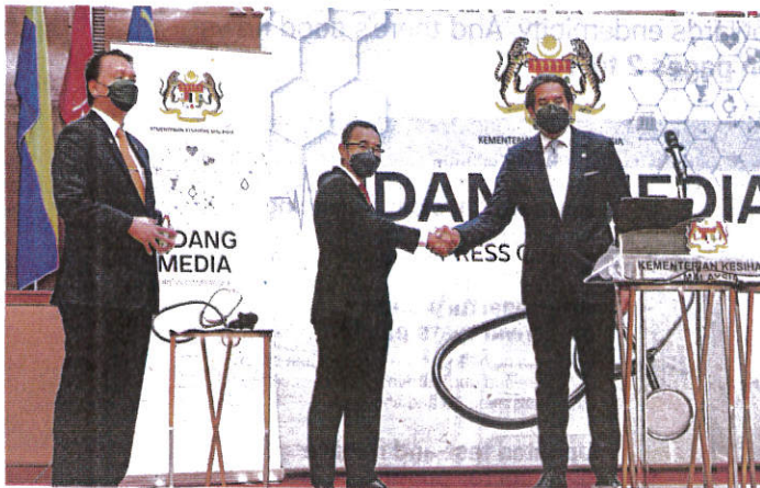
On a new direction: Khairy (right) greeting Dr Noor Azmi with a handshake while Dr Noor Hisham looks on at the press conference in Putrajaya.

"We encourage the public to continue wearing face masks in crowded places like night markets and stadiums. Those who are symptomatic or are having activities with high-risk groups such as senior citizens and children should also do so," he said.