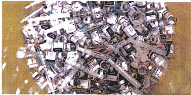
TEMPOH jangka hayat vaksin Covid-19 akan berubah jika ada perubahan kepada suhu penyimpanan.

NPRA luluskan perlanjutan tempoh hingga 31 Mei